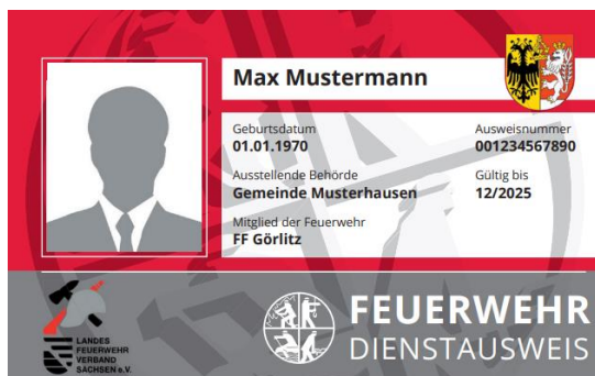
Abbildung 1: Vorderseite